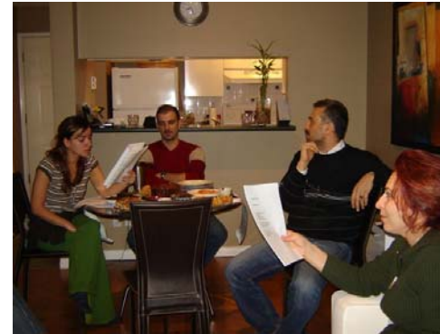
“Şiir Günü provalarından bir başka görüntü”