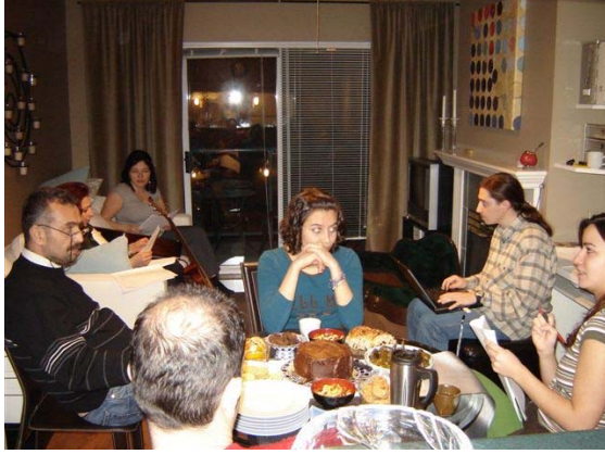
“Şiir Günü provalarından bir görüntü”