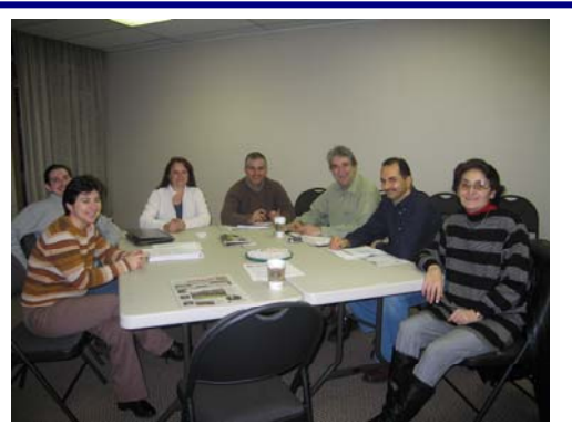
Derneğimizin ofisinde gerçekleştirilen yönetim kurulu üyeleri ve etkinlik koordinatörleri toplantısı