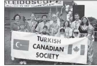
Kaleidoscope 2004 Festivali

21) 10 Temmuz 2004 - Richmond'daki Kaleidoscope Kültür Festivali'ne kültür masamız ve etnik yiyecek satışımız ile katıldık.